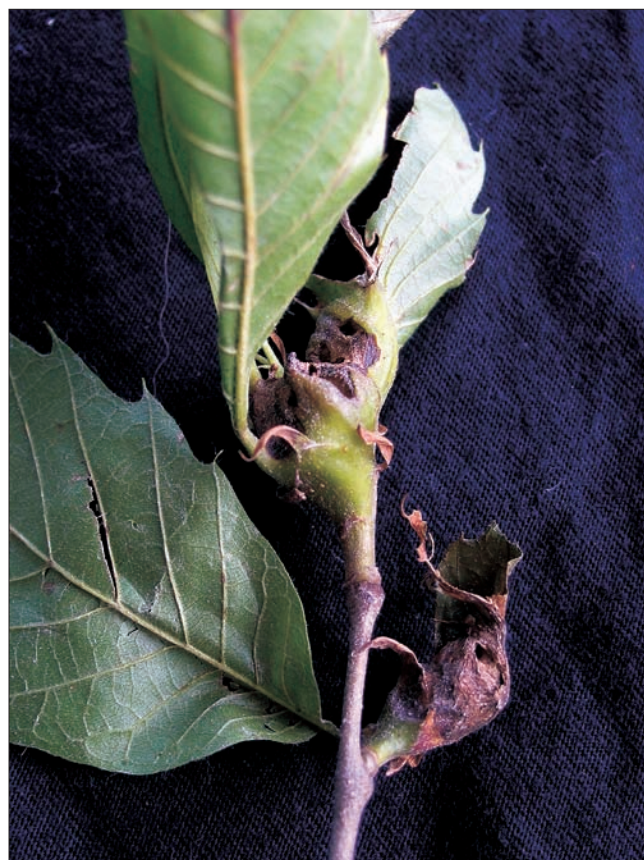
Slika 3. Stare šiške (rujan)