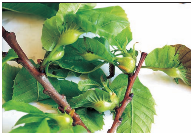
Slika 2. Simptomi napada kestenove ose šiškarice (svibanj-mlade šiške s ličinkama)

Kestenova osa šiškarica napada samo pitomi kesten i ne može se zamijeniti niti s jednim drugim štetnikom. Šiške su 5-20 mm velike, zelene ili ružičaste, lako uočljive na izbojcima i listovima. Razvijaju se na mladim izbojcima, peteljkama ili na glavnim žilama lista (Slika 2). Nakon izlaska imaga šiške se osuše, postanu drvenaste (Slika 3) i ostaju na izbojcima i do dvije godine. Šiške su lako uočljive i prepoznatljive, no jaja i ličinke prvog larvalnog stadija mogu se utvrditi samo mikroskopskim pregledom.