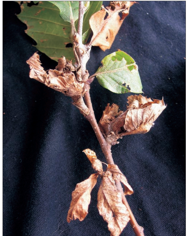
Slika 4. Deformacija listova i izbojaka zbog napada kestenove ose šiškarice

Budući da je kestenova osa šiškarica karantenski štetnik na području Republike Hrvatske na njega se primjenjuju odgovarajuće zakonske mjere (MPRRRR 2008). Iako je poduzeto više metoda zaštite protiv ovog štetnika, niti jedna se nije pokazala potpuno učinkovitom. Zbog svoje biologije i zaštićenosti u šiški primjena insekticida je potpuno nedjelotvorna. U manjim nasadima pitomog kestena moguća je kontrola mehaničkim metodama: uklanjanjem i spaljivanjem zaraženih izbojaka. U šumi i na većim površinama ova metoda je teško primjenjiva. U domovini ovog štetnika, Kini, prirodni neprijatelji, posebno parazitoide iz reda Hymenoptera učinkovito reguliraju njegovu populaciju (Abe i sur. 2007). Torymus sinensis Kamijo (Hymenoptera: Torymidae) se već koristi kao biološko sredstvo suzbijanja u Japanu i Koreji i istraživanja pokazuju njegovu visoku učinkovitost (Moriya i sur. 2003). U Italiji se rade pokusi s uzgojem i